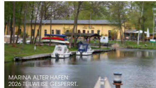
MARINA ALTER HAFEN: 2026 TEILWEISE GESPERRT.

Freizeit: 1 km 0,1 km Wassersport: 0,5 km Übernachtung: 0,5 km Lage: 8 km 0,3 km Ziegelei 5, 16792 Mil- denberg (0 33 07) 42 05 04 uk@marina-alter- hafen.de www.marina-alter-hafen.de