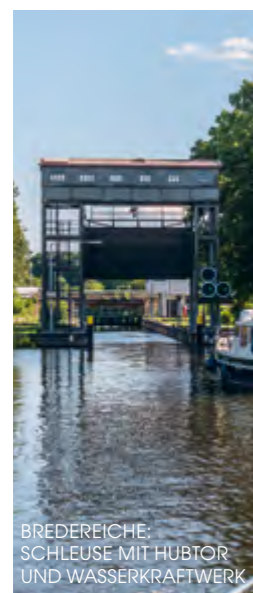
BREDEREICHE: SCHLEUSE MIT HUBTOR UND WASSERKRAFTWERK

Ab Fürstenberg fließt die Obere Havel zunächst noch durch zwei schöne Seen, dann windet sie sich in sanften Biegungen durch Naturschutzgebiete, ausgedehnte Wälder und Äcker, bis sie die Schorfheide erreicht, ein besonders urwüchsiges Sumpf- und Waldgebiet mit Hochmooren und anderen Feuchtbiotopen. Im gleichnamigen Biosphärenreservat brüten sogar Kraniche und Graugänse. Bis Zehdenick folgt man noch dem krummen Flusslauf der Havel. Der Landschaft hat ihre frühere Funktion als Baustofflieferant für Berlin bis hierher nicht geschadet. Aus den ehemaligen Tonstichen sind beiderseits der Wasserstraße idyllische Naturreservate für Pflanzen und Tiere geworden. Ab Zehdenick zu Tal ist die obere Havel jedoch kanalisiert. Die glorreiche Vergangenheit kann kaum über die funktionelle Optik hinwegtrösten: An diesem Stück Kanal wurde fast 200 Jahre lang ständig gebaut.