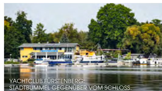
YACHTCLUB FÜRSTENBERG: STADTBUMMEL GEGENÜBER VOM SCHLOSS.

Versorgung: 0,1 km 0,1 km 0,1 km 0,1 km 0,1 km 0,1 km 0,1 km Freizeit: 1,3 km Wassersport: 0,1 km 0,1 km 0,1 km Übernachtung: 0,1 km 0,1 km 0,1 km Lage: 1 km 10 km Taxi (01 72) 4 24 84 92 Stolpseestraße 16, 16798 Fürstenberg OT Himmelpfort (0 39 81) 42 15 60 stolpsee-bootshaus.de Tipp: Landzugang über Rampe. Keine Liegeplatzreservierung möglich.