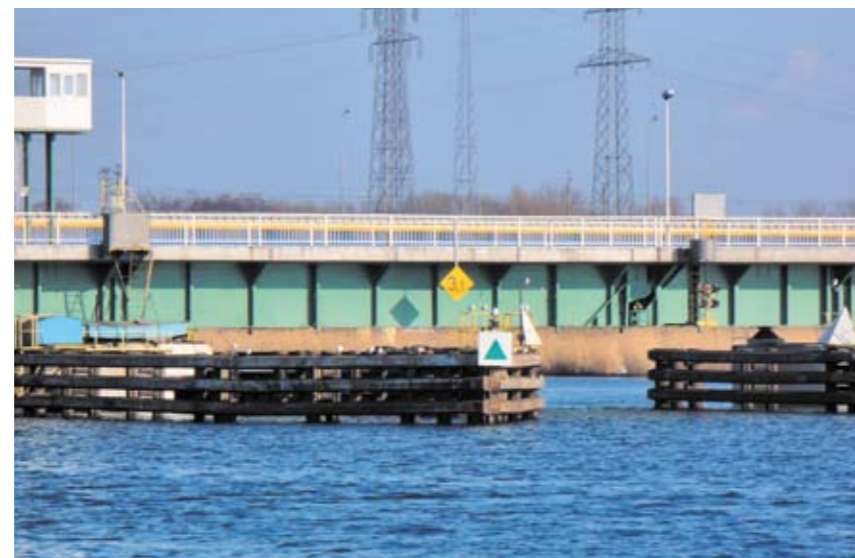
Passen wir da durch? Die Drehbrücke in Wolin erscheint vom Wasser aus viel niedriger als sie ist.