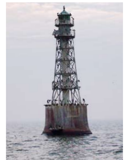
Großes Stettiner Haff, Kaiserfahrt: Leuchtturm