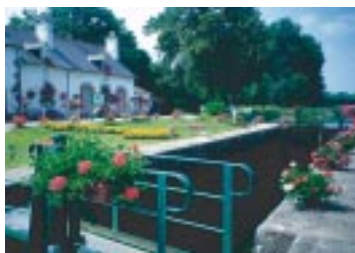
Kammerspiele: Hier wird die Schleuse zur Bühne.

Lieber zu früh stoppen als zu spät! Wenn Sie noch weiter nach vorne müssen, kann der Bugmann das Boot mit der Leine ein Stück ziehen.